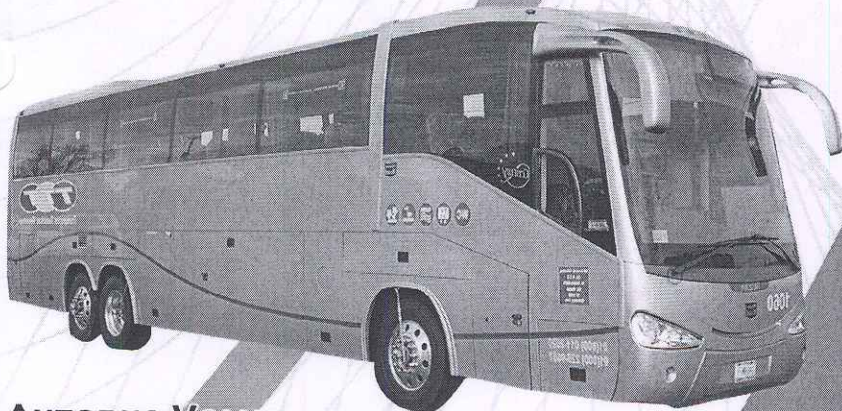
AUTOBUS VOLVO CAPACIDAD DE 40-45 PASAJEROS