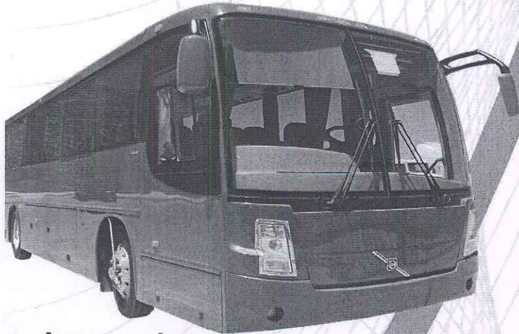
AUTOBUS IRIZAR CAPACIDAD DE 50-53 PASAJEROS