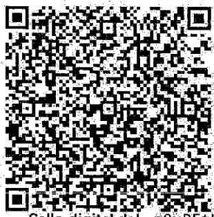
Sello digital del emisor

Subtotal 232.76 IVA 16% 37.24 TOTAL 270.00