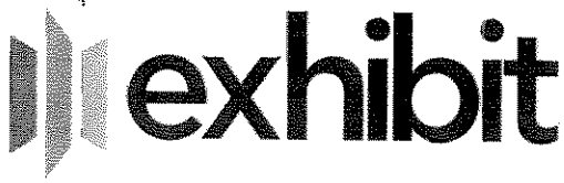
Exhibit Chihuahua, S. de R.L. M.I. 8959 Calzada del Rio Ciudad Juárez CHH 32400 México