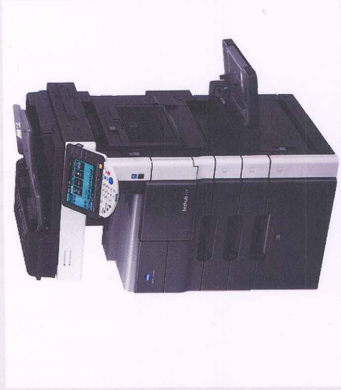
BIZ HUB 361 finanzas y biblioteca