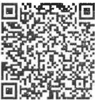
Versión CFDI 4

ESTE DOCUMENTO ES UNA REPRESENTACION IMPRESA DE UN CFDI Formo de Pago: EFECTOS FISCALES AL PAGO PUE PAGO EN UNA SOLA EXHIBICION